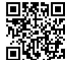
宿舍網路支援系統